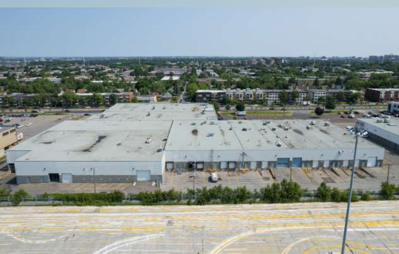
8552-8648 Boulevard Pie-IX