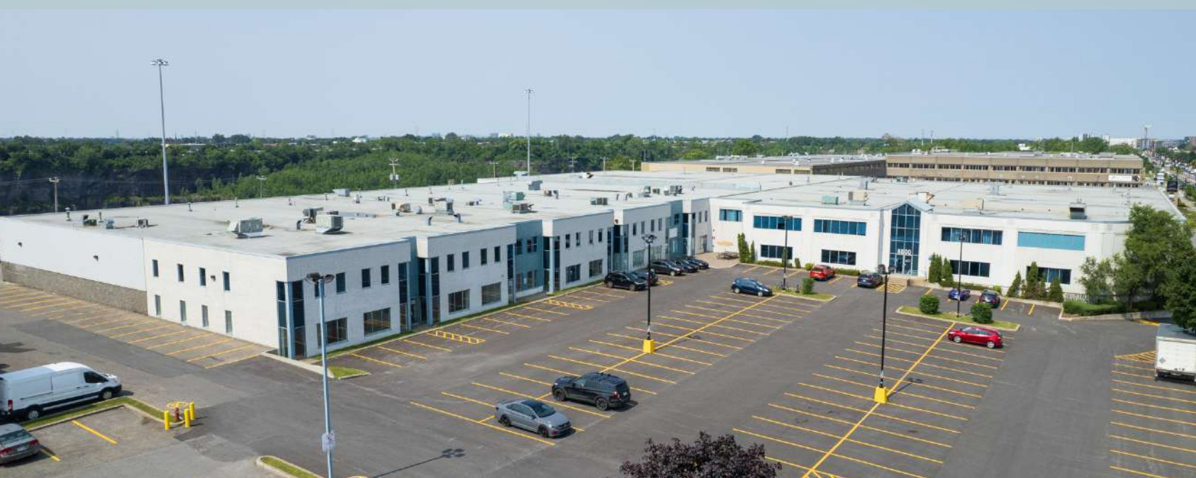
8552-8648 Boulevard Pie-IX