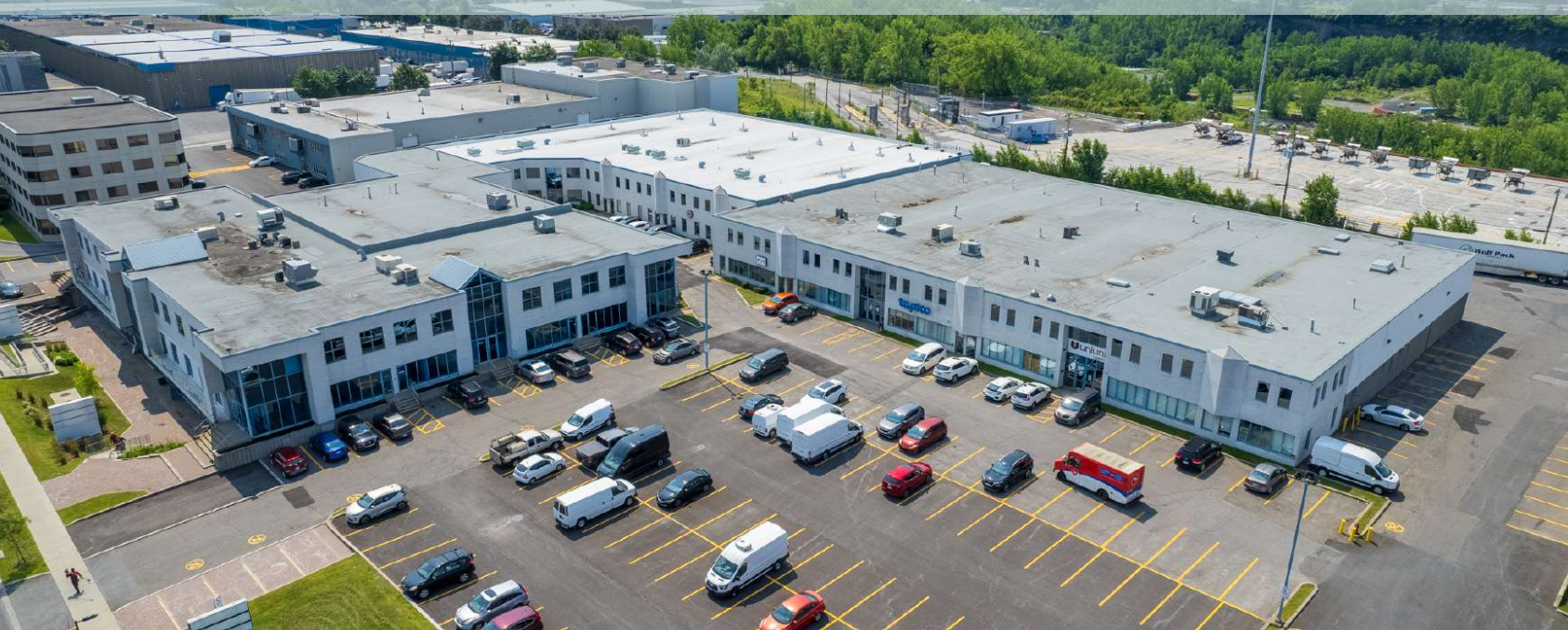
8740-8878 Boulevard Pie-IX