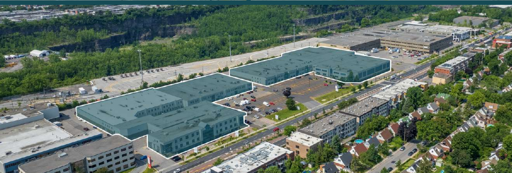
8740-8878 Boulevard Pie-IX